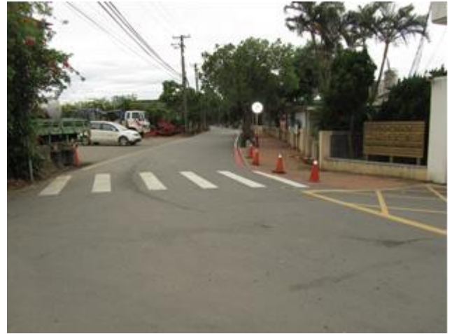
說明：家長提供學校對面空地讓學校規劃為家長汽車接送區