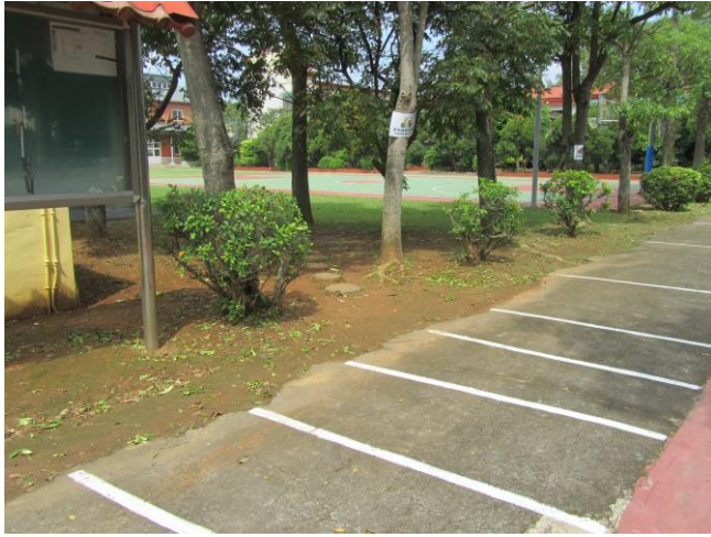
說明：規劃家長機車接送區