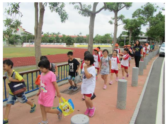
說明：設置學生通行步道