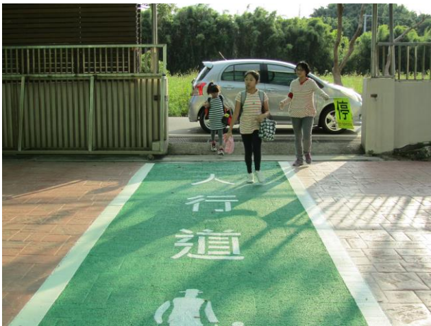
說明：學生專用步道