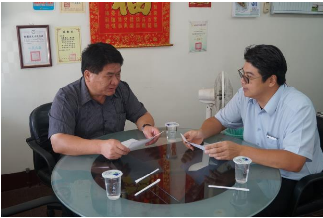
說明：上陞土地仲介股份有限公司 忠愛路愛心商店