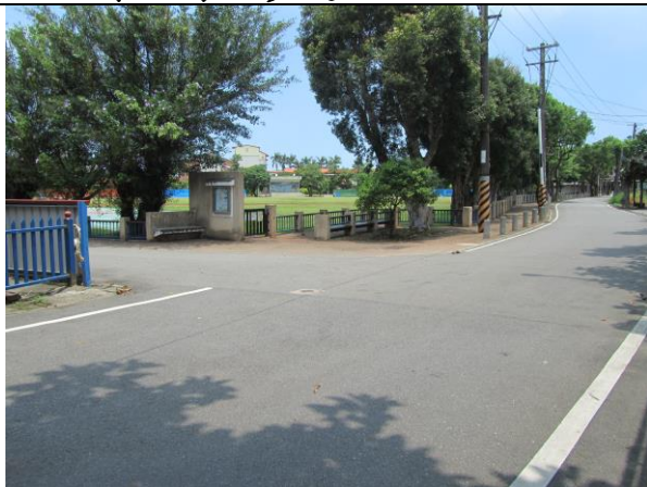
說明：家長汽機車送學生上學由忠愛路轉進學府路口讓學生下車運用 200 公尺長通行步道上學