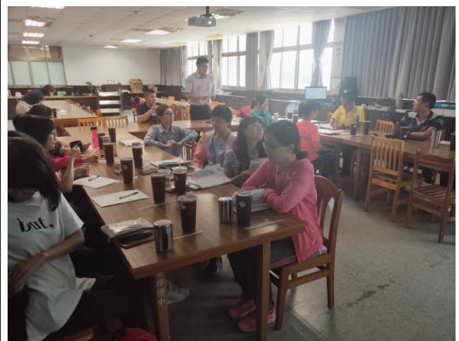
說明：定期召開委員會議追蹤與檢討愛心商店執行效益