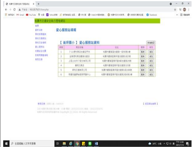
說明：於桃園市交通安全執行歷程網站- 登錄本校愛心商店資料